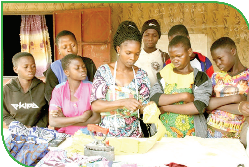
Filles victimes d'exploitation mises en apprentissage de couture à Koussoukougou commune de Boukoubé

Ces actions se poursuivront jusqu'en 2027, afin de toucher le maximum d'enfants vulnérables, surtout des filles. DEDRAS et ses partenaires s'engagent à continuer de lutter pour que chaque enfant au Bénin jouisse de ses droits fondamentaux, notamment le droit à une identité légale.