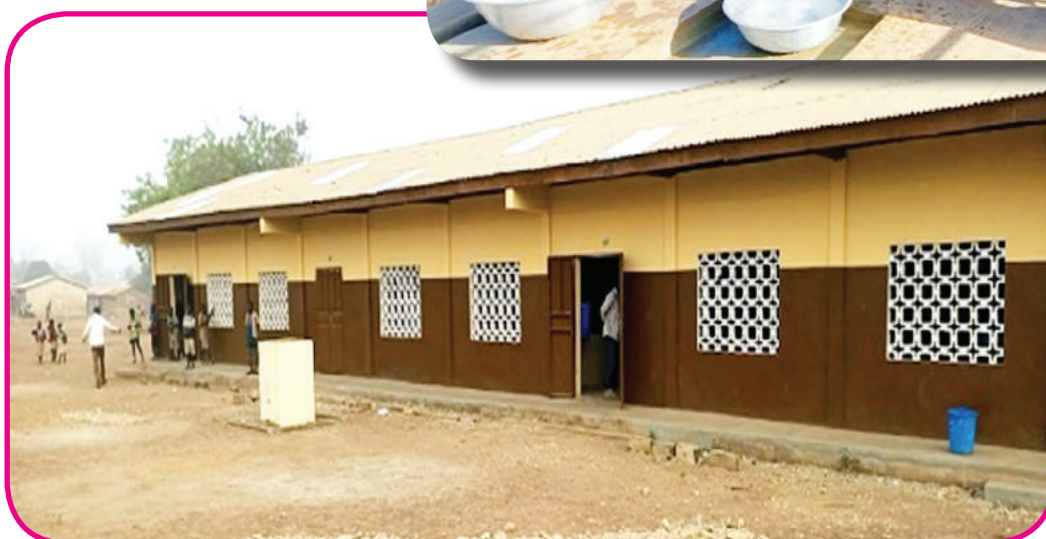
Réfection d'un module de trois classes par le projet AGIR-Bénin à l'EPP Sayakrou commune de Péhunco