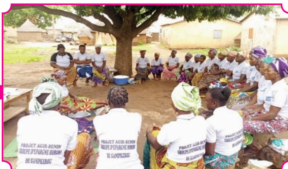
Association Villageoise d'Epargne et de Crédit Horoma de Ganikpérou en réunion de partage de fonds de cotisation

Les AVEC mises en place par DEDRAS à travers le projet AGIR-BENIN jouent un rôle crucial dans la promotion de la scolarisation des filles et l'autonomisation des femmes. En permettant aux femmes de participer activement aux prises de décision et à la gestion des écoles via la caisse éducation, les AVEC renforcent leur pouvoir d'action et leur estime de soi. Leur implication dans la lutte contre les violences basées sur le genre crée un environnement plus sûr et favorable à l'éducation des filles. Grâce à ces initiatives, les femmes deviennent des piliers de changement, soutenant et défendant le droit à l'éducation pour chaque fille, assurant ainsi un avenir plus équitable et prospère pour tous. Fort des avantages et bienfaits des AVEC pour les communautés à la base, DEDRAS a étendu cette approche à la plupart de ses projets et entend le généraliser pour tous ses projet et programmes de développement au Bénin.