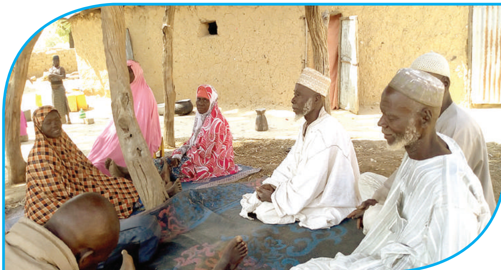
Membres d'un comité villageois de veille de la commune de Karimama réunis pour discuter des enjeux liés aux droits de l'enfant

Au Bénin, la protection des enfants reste une priorité absolue, confrontée à des défis persistants tels que le mariage précoce et l'exploitation économique et d'autres formes de violences notamment parmi les filles. Depuis plusieurs années, DEDRAS s'engage résolument dans la protection des enfants au Bénin à travers ses initiatives novatrices de comités de veille communautaire. Ces comités de veille se révèlent être des piliers essentiels dans la protection et l'éducation des enfants. En partenariat avec les communautés locales, ces comités sont devenus des agents de changement, détectant et répondant aux violations des droits de l'enfant avec détermination et efficacité.