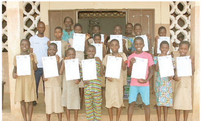
Les apprenants de la classe de première année de cours moyen de l'EPP de Koudengou heureux avec leurs actes naissance en main

très abîmé et c'était un casse-tête pour les parents.