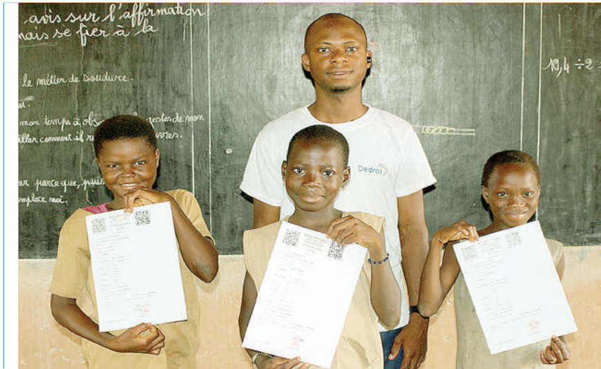
Quelques enfants de l'école primaire de Koudengou/Natitingou avec leurs actes de naissance sécurisé reçus de DEDRAS

Dans un monde où l'accès aux droits fondamentaux est crucial, chaque enfant mérite de bâtir son avenir sur des bases solides. Au Bénin, cette opportunité est souvent compromise dès la naissance par l'absence d'un document essentiel : l'acte de naissance. Heureusement, l'ONG DEDRAS, en collaboration avec ses partenaires Woord en Daad et la Fondation AFAS, change progressivement cette situation. Grâce à leur projet ambitieux «Briser les chaînes du travail et de l'exploitation domestique des enfants au Bénin et au Burkina Faso», de nombreux enfants voient leur avenir se débloquer.