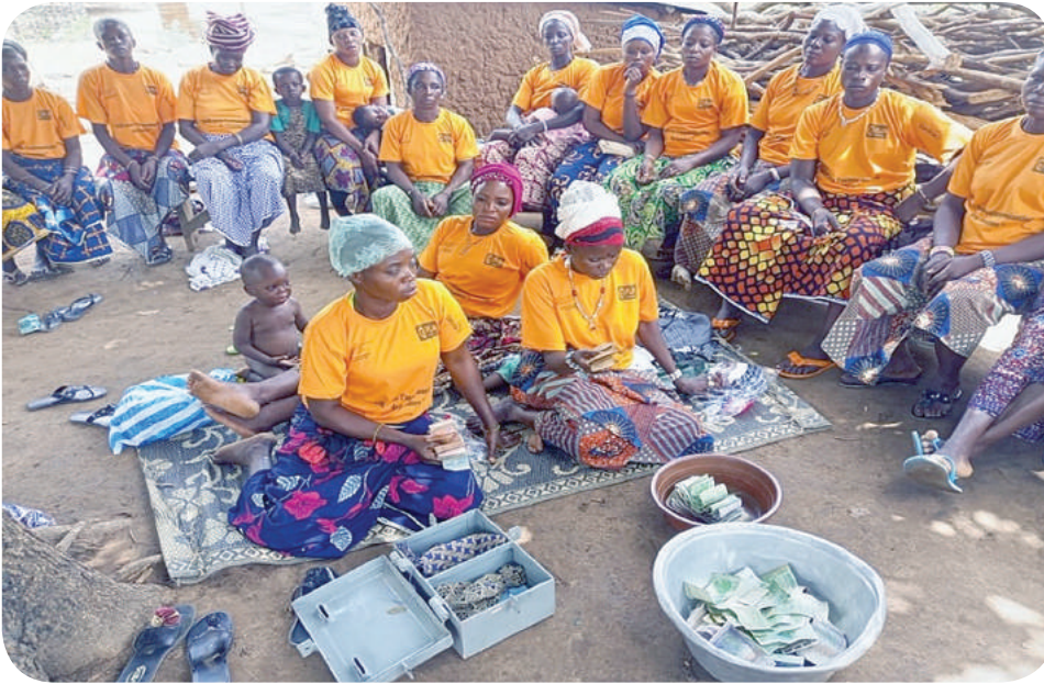
Groupe d'Épargne su dom see de Guilmaro en plein partage de fond de cotisation

L'une des initiatives clés du projet AGIR-BENIN est le soutien aux Associations Villageoises d'Épargne et de Crédit (AVEC), un véritable levier pour réduire la pauvreté des ménages vulnérables et stimuler le secteur éducatif dans les communes de l'Atacora. En raison de l'inégalité des sexes qui entrave l'accès des femmes aux ressources et à leurs droits, DEDRAS ONG a mis en place 90 AVEC dans les localités ciblées pour soutenir les ménages à faible pouvoir d'achat.