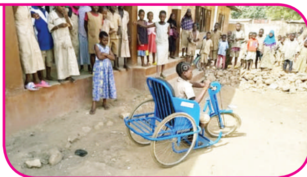
Remise d'un vélo tricycle à une élève handicapé à l'EPP centre de Kouandé

Acquisition de 37 vélos tricycles au profit des enfants handicapés des écoles d'intervention du projet AGIR Bénin