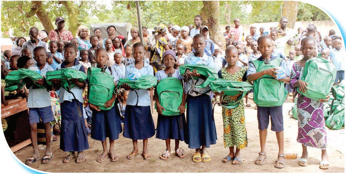
Quelques enfants parrainés par DEDRAS du Complexe Scolaire Evangélique les Flambeaux recevant les kits scolaires

DEDRAS ONG, dévouée à la promotion de l'éducation au Bénin, a mis en place le projet Education-Parrainage avec l'appui financier de Woord en Daad pour créer un système éducatif équitable, inclusif et de qualité.