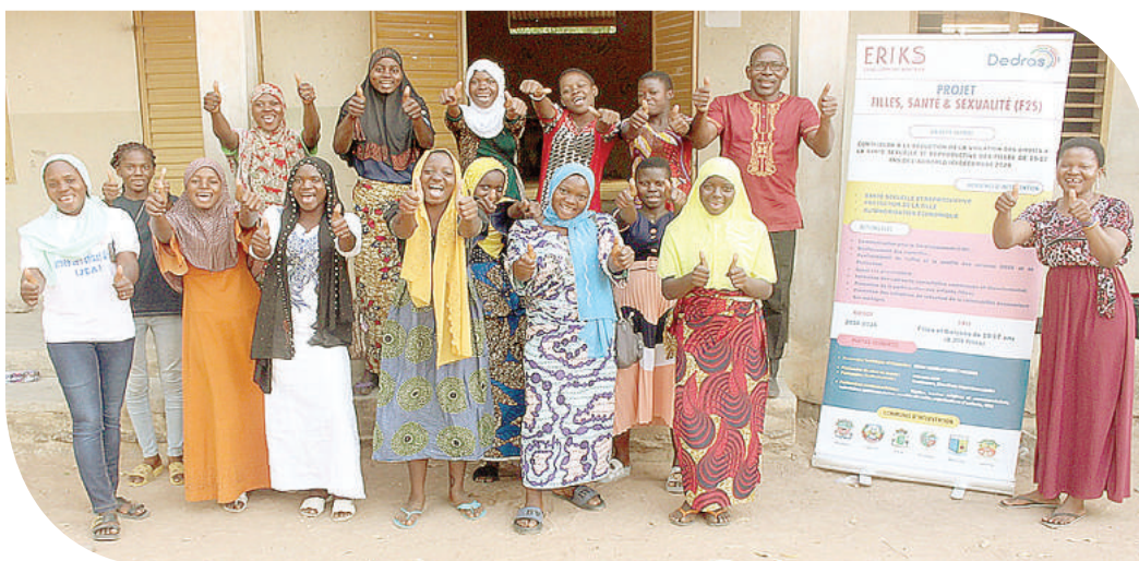
Photo de famille des filles et de quelques membres de l'équipe projet de F2S

Depuis 2022, DEDRAS ONG met en œuvre le projet « Filles Santé & Sexualité » (F2S), financé par son partenaire suédois ERIKS, dans le département de l'Alibori. Ce projet transforme la vie des jeunes filles en touchant les 395 villages des six communes de ce département.