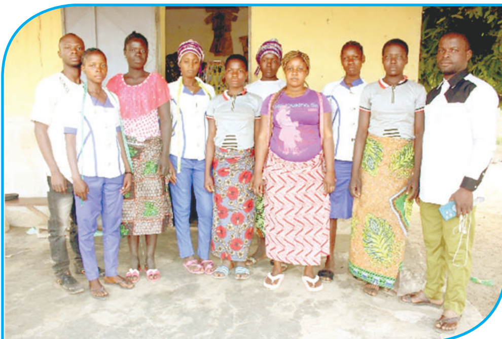
Filles à risque et victimes d'exploitation en apprentissage de la couture à Perma commune de Natitingou avec leur patronne, le conseiller en protection de Dedras et le pasteur du village