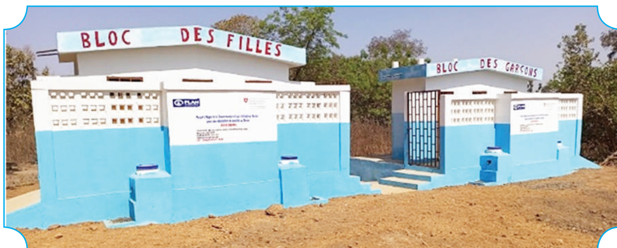
Construction de deux blocs de latrines handi sexo spécifiques à trois cabines à l'EPP Brignamaro/Kérou

Le projet AGIR-BENIN a fourni 34 équipements solaires photovoltaïques, réhabilité 53 salles de classe et doté les écoles de 915 mobiliers, améliorant ainsi les conditions d'apprentissage pour des milliers d'élèves. En outre, 42 latrines handi-sexo spécifiques et 17 points d'eau ont été construits ou réhabilités, créant un environnement scolaire plus hygiénique et adapté aux besoins des filles.